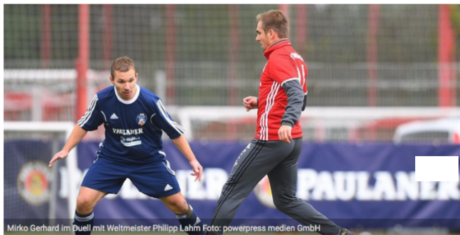
Mirko Gerhard im Duell mit Weltmeister Philipp Lahm