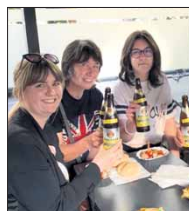
Die berühmte Currywurst durfte natürlich nicht fehlen.