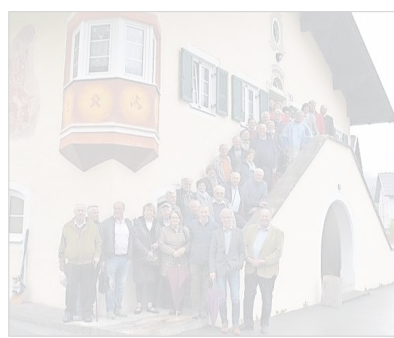
Der ABC besuchte unter anderem das Haupthaus der 1940 für die Südtiroler Optanten errichteten Gemeinschaftssiedlung in der Marktgemeinde Reutte. © Alle Rechte vorbehalten

GEMEINSAM REISEN: ABC besucht Außerfern und Pfaffenwinkel