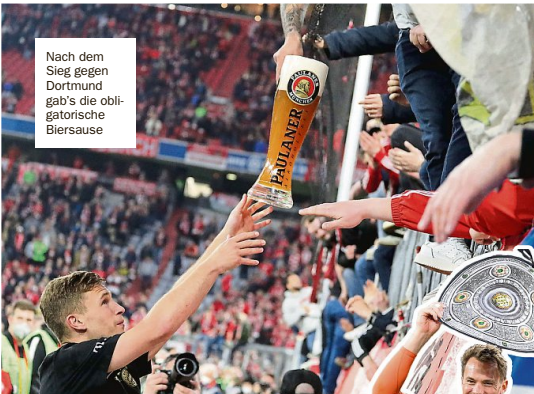
Nach dem Sieg gegen Dortmund gab's die obligatorische Biersause

▶ Spielt Bayern in den neuen Trikots? Ja. Die Mannschaft wird auf dem neuen Heimtrikot von Adidas ein einziges Mal ein Sonderbadge Serienmeister auf der Brust tragen. ▶ Hat Nagelsmann Gnade mit Stuttgart? Für den VfB mit Trainer und Nagelsmann-Kumpel Pellegrino Matarazzo geht es im Fernduell mit Hertha um den Klassenerhalt. „Sie sind in einer schwierigen Situation, hatten viele Verletzungen in entscheidenden Phasen. Ich will das Spiel geschickt, auch wenn ich Rivalis Mensch und Fachmann sehr schätze“, stellte Nagelsmann klar. ▶ Befürchtet der Trainer negative Auswirkungen des Ibiza-Trips? Nein. „Unsere Spieler sind mündig und dürfen entscheiden, was sie an ih-